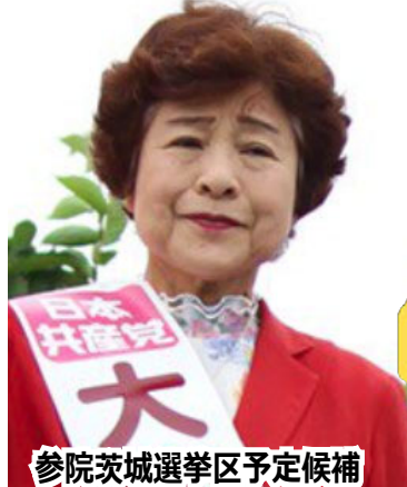
参院茨城選挙区予定候補