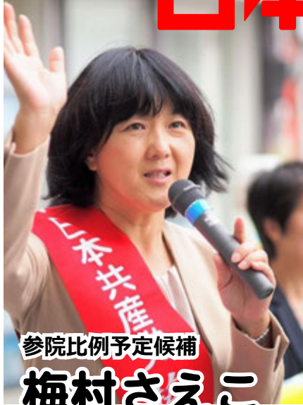
参院比例予定候補