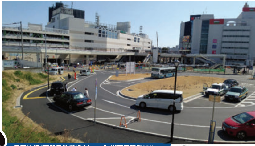
民間施行(再開発準備組合)で、「A街区再開発ビル」の建設が予定される取手駅西口A街区地区

取手駅西口前に民間が計画する「駅前開発ビル」への、取手図書館など「複合公共施設整備計画」の突然の発表(3月15日号取手市広報)に、市民の皆さんから「いつの間に」、「議会で決まった話もないのに」・・・驚きの声が上がっています。