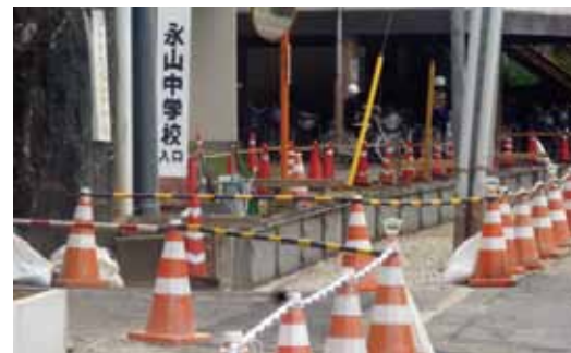
永山中正門付近整備工事中