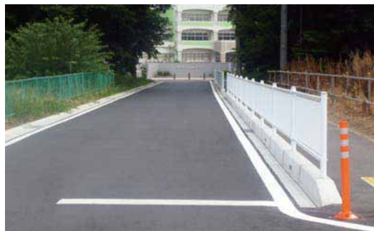
永山小入口整備完了

ご迷惑をおかけします 安全な通学路にするため 交差点を改良しています 平成26年11月28日まで 時間帯 9:00～17:00 交差点改良工事 発注者 取手市役所 建設部 道路課 電話 0297-74-2141 施工者 昭和通商株式会社 電話 0297-78-9759