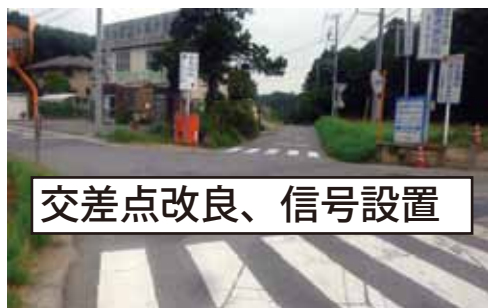
交差点改良、信号設置