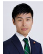
憲法活かし希望ある日本に 山添拓 党中央委員/弁護士