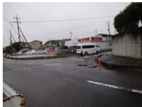
JAとりで総合医療センター前交差点