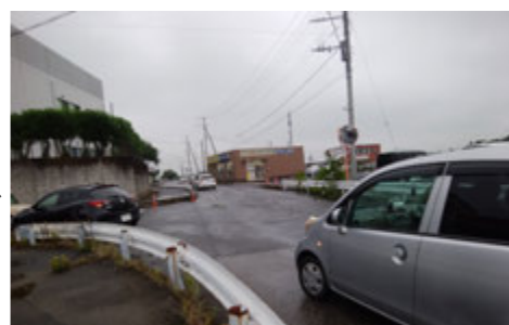
JAとりで総合医療センターへ行く道路