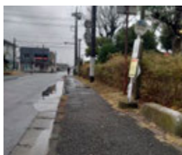
マサダ近く八重洲団地バス停

（バスが通るたびに家が揺れる、傷んだ凹凸道路に水が溜まります。危険な箇所は早急に対応願います。）