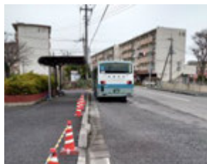
旧井野小前バス停

担当課（建設・管理課） 今の工事、1年1工区が最適であり早くすることは無理である。 水はけが悪い・歩行者道の凹凸については現地調査をします。